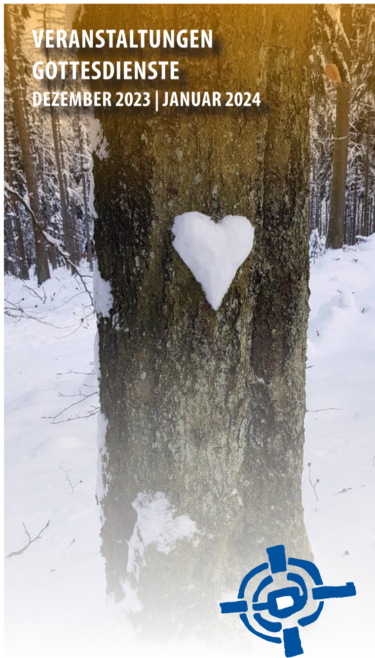
TITELFOTO: © CHRISTINE SCHMIDT | 2023|22