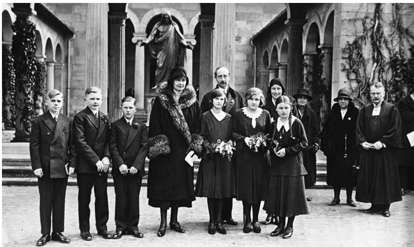
11. April 1931